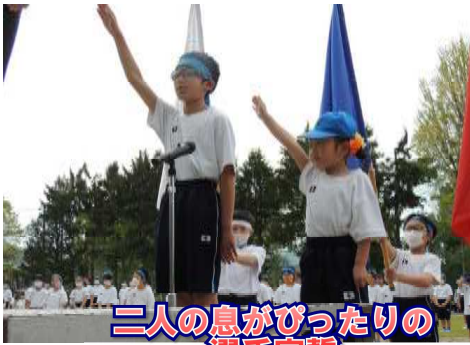
二人の息がぴったりの 選手宣誓