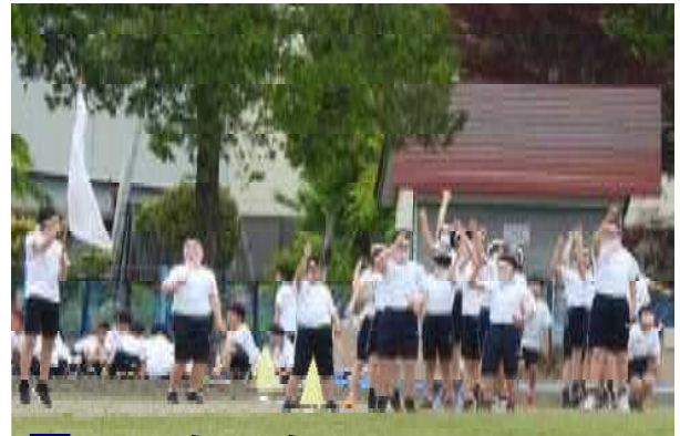
熱のこもった 応援合戦 各色の工夫 満載!!