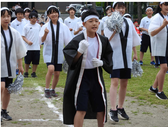
時折小雨がぱらつく中でも みんな全力で 頑張りました