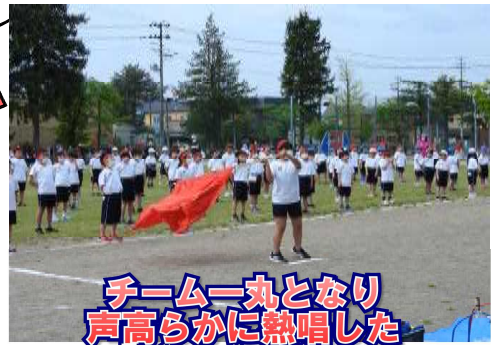
チーム一丸となり 声高らかに熱唱した 「ゴーゴーゴー」