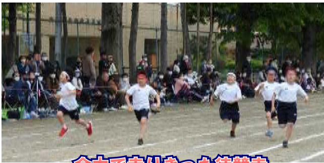
全力で走りきった徒競走