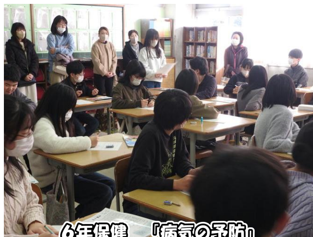
6年保健 「病気の予防」

学期末のPTAには、お忙しい中たくさんのおうちの方々にご来校いただきまして、ありがとうございました。子どもたちは、落ち着いて学習に取り組んでいました。