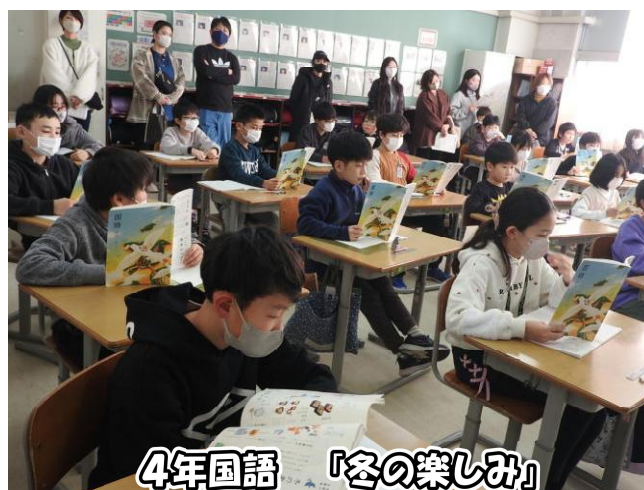
4年国語 「冬の楽しみ」