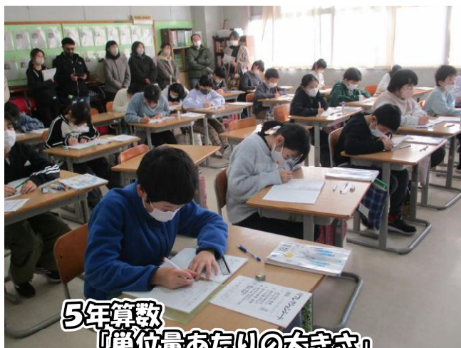
5年算数 「単位量あたりの大きさ」