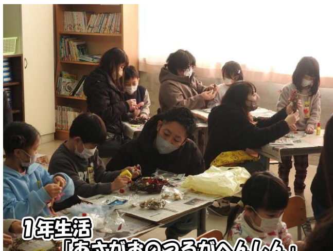
1年生活 「あさがおのつるがへんしん」