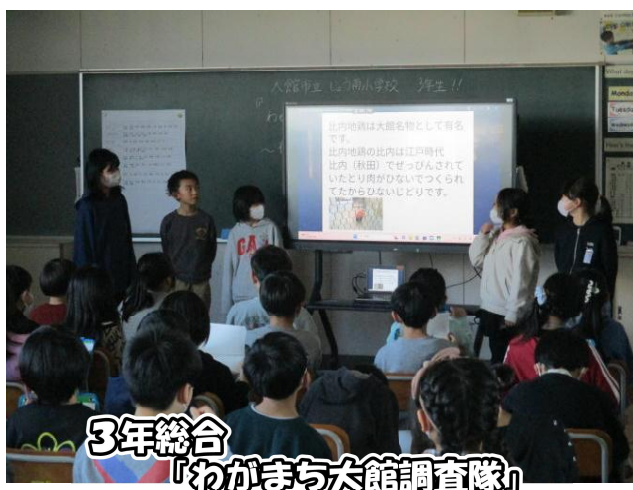
3年総合 「わがまち大館調査隊」